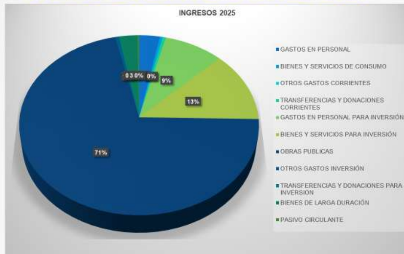
GRÁFICO DE INVERSIONES 2025