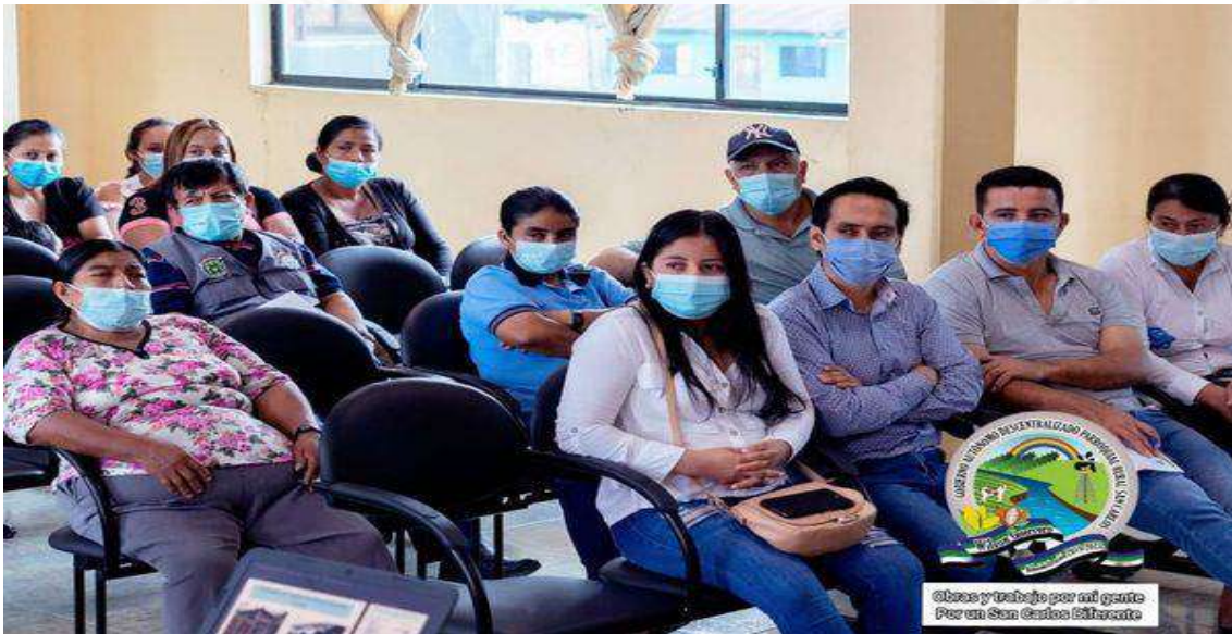
Obras y trabajo por mi gente Por un San Carlos diferente